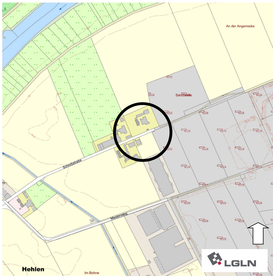
Übersichtsplan (Kartengrundlage AK5)